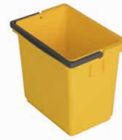
81994 Hink SmartCar 8 liter gul