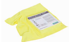
82145 Microwit SOFT gul på möbler