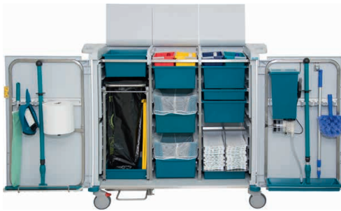
80975 KeyCar Medium SA